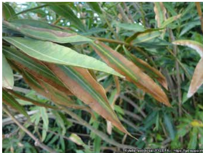
Συμπτώματα της ασθένειας σε μικροδάφνη

Μία από τις καινοτομίες που αναπτύσσεται από τους εταίρους του διεθνούς δικτύου έρευνας για την Ξυλέλλα «Lubixyl innovations», και συγκεκριμένα από τα εργαστήρια Tarandon και Plant Pathology Laboratory of Gembloux, είναι μια λύση