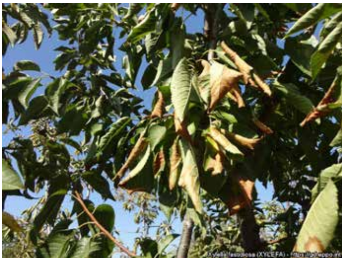
Συμπτώματα της ασθένειας σε κερασιά

Με δεδομένη τη σοβαρότητα της απειλής για την αγροτική οικονομία, το περιβάλλον και την επισιτιστική ασφάλεια στην Ευρώπη, η EFSA (European Food Safety Authority) σε συνεργασία με την Ευρωπαϊκή Επιτροπή οργάνωσε τον Νοέμβριο του 2015 στις Βρυξέλλες συνάντηση εργασίας για τη χάραξη ερευνητικού σχεδιασμού με μαζική συμμετοχή από την πλειοψηφία των χωρών-μελών αλλά και από άλλες ηπείρους. Οι ερευνητικές προτεραιότητες της Ελλάδας παρουσιάστηκαν από τον ΕΛΓΟ-ΔΗΜΗΤΡΑ. Σε συνέχεια σχετικής πρόσκλησης υποβολής ερευνητικών προτάσεων, το Ινστιτούτο Ελιάς, Υποτροπικών